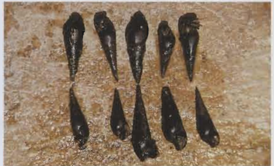
Aus diesem Bach in der Provinz Buleleng im äußersten Norden der indonesischen Insel Bali (links) stammen die Turmdeckelschnecken der Gattung Melanoides (rechts). Bei Importen weiß man allerdings nie, was man sich noch mit einschleppt.