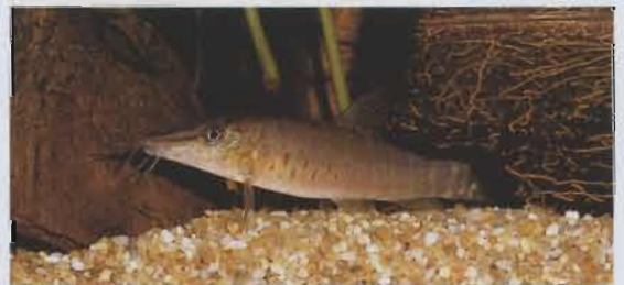
Langschnauzen-Schmerle, Botia helodes .