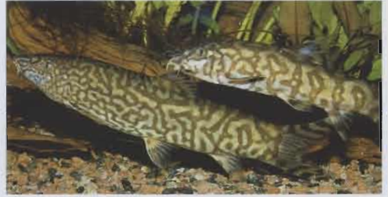
Netzschmerle, Botia lohachata .