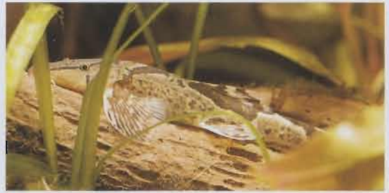
Schneckenfressende Vertreter aus der Familie Balitoridae: Acanthocobitis urophthalmus von der Insel Sri Lanka (links) und die in Fließgewässern substratorientierte Homaloptera orthogoniata aus Malaysia (rechts).

0,25 mm lang, kann im Wasser frei schwimmen und hat zwei Saugnäpfe: Einen Rachen- und einen Bauchsaugnäpf mit kleinen Zähnchen. Im Körper der Schmerle lebt die Trematode dann als Metacercarie und wurde unter dem Namen Diplostomum cobitidis von VON LINSTOW (1890) erstmalig beschrieben. In diesem Falle scheint die Invasion streng wirtsspezifisch stattzufinden, denn als zweiter Zwischenwirt wurden in dem Gewässer stets nur Barbatula barbatula und Cottus gobio gefunden, nie aber Cobitis taenia , Misgurnus fossilis und andere Arten.