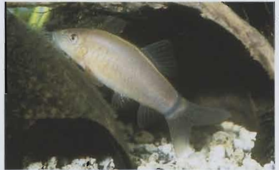
Aalstrichschmerle, Botia morleti .