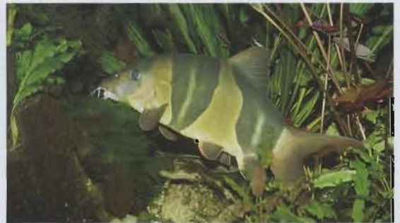
Prachtschmerle, Botia macracanthus .